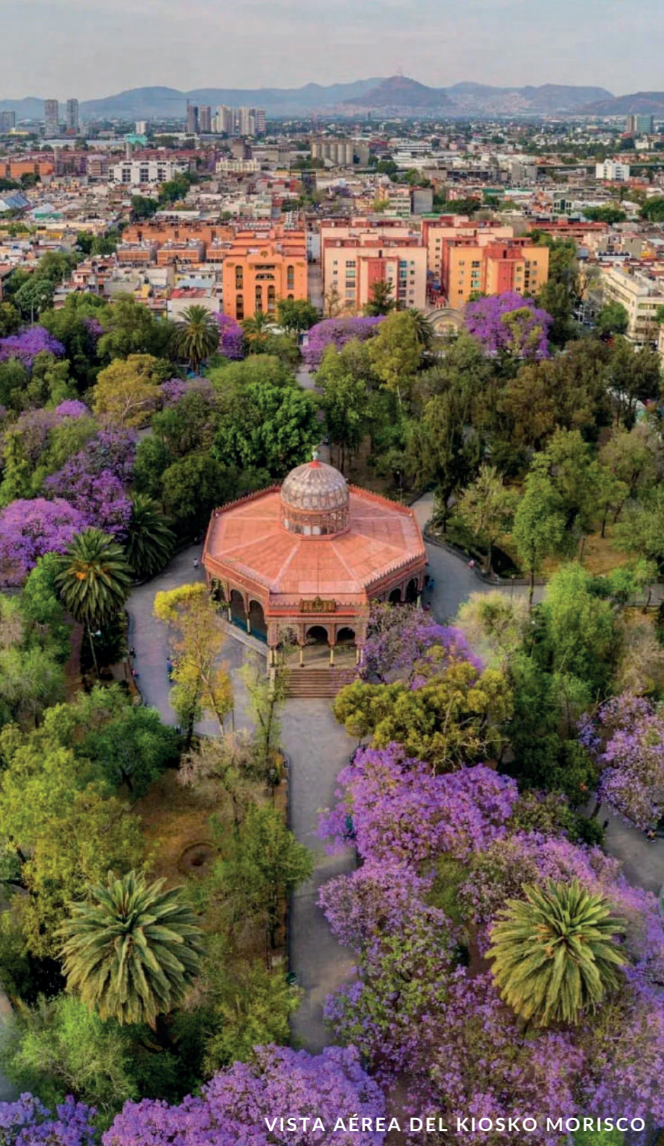
VISTA AÉREA DEL KIOSKO MORISCO