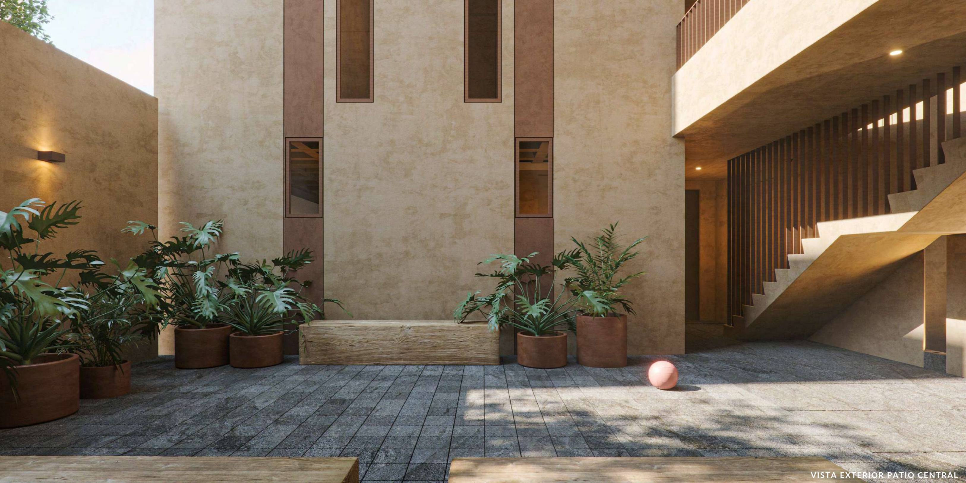
VISTA EXTERIOR PATIO CENTRAL