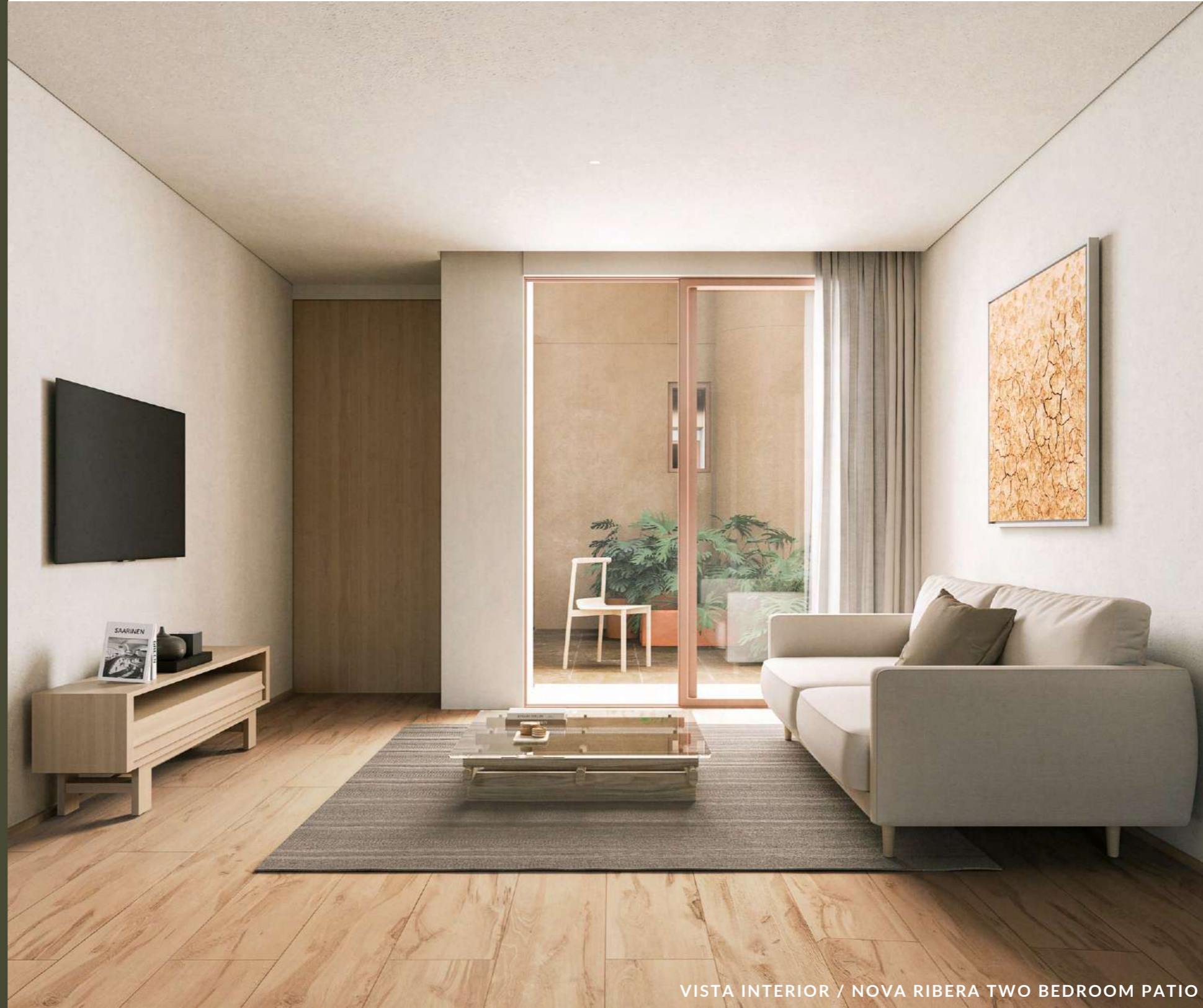
VISTA INTERIOR / NOVA RIBERA TWO BEDROOM PATIO