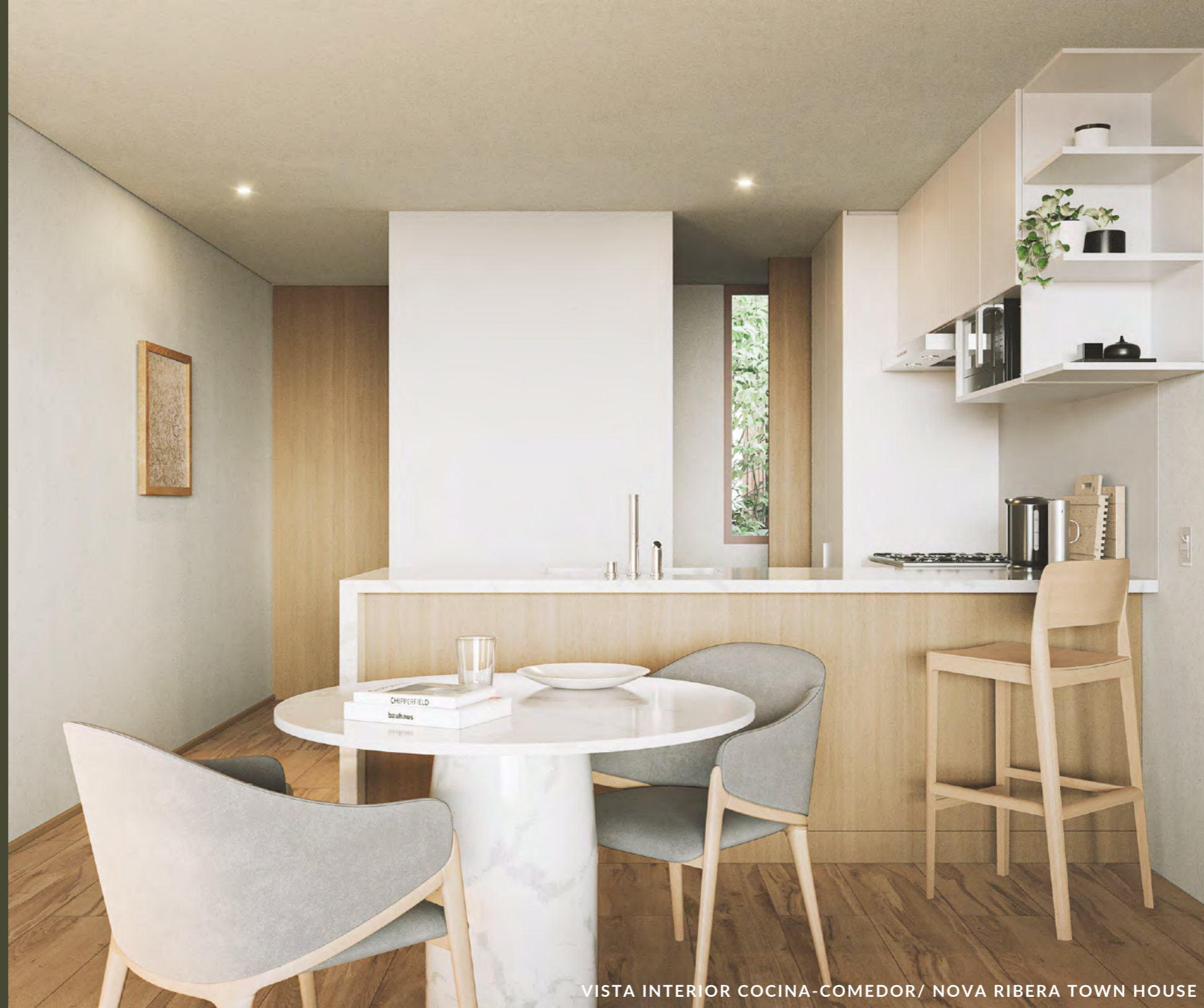
VISTA INTERIOR COCINA-COMEDOR/ NOVA RIBERA TOWN HOUSE