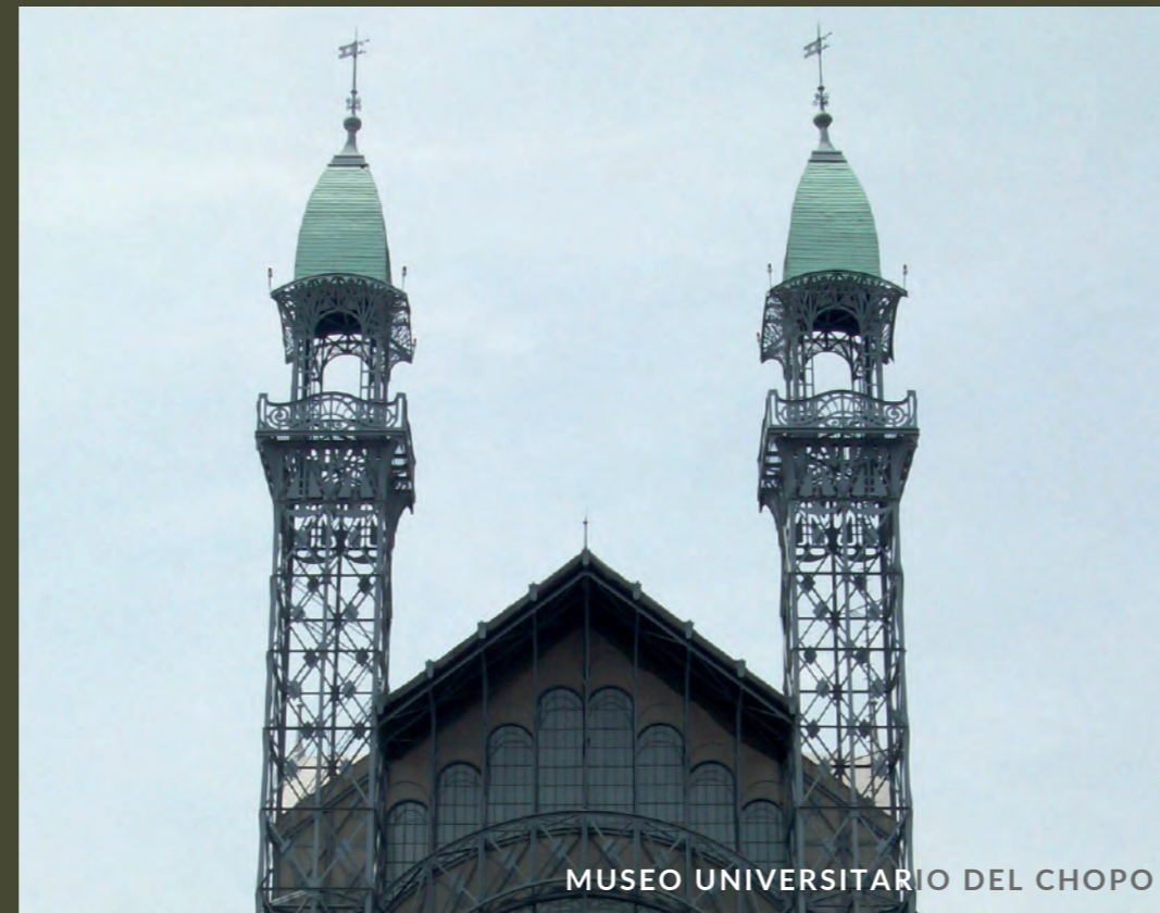
MUSEO UNIVERSITARIO DEL CHOPO

El barrio de Santa María está renaciendo con sus bellos museos, bibliotecas, arquitectura de tintes neoclásicos y, recientemente, la incursión de galerías de arte, panaderías gourmet y restaurantes de especialidad.